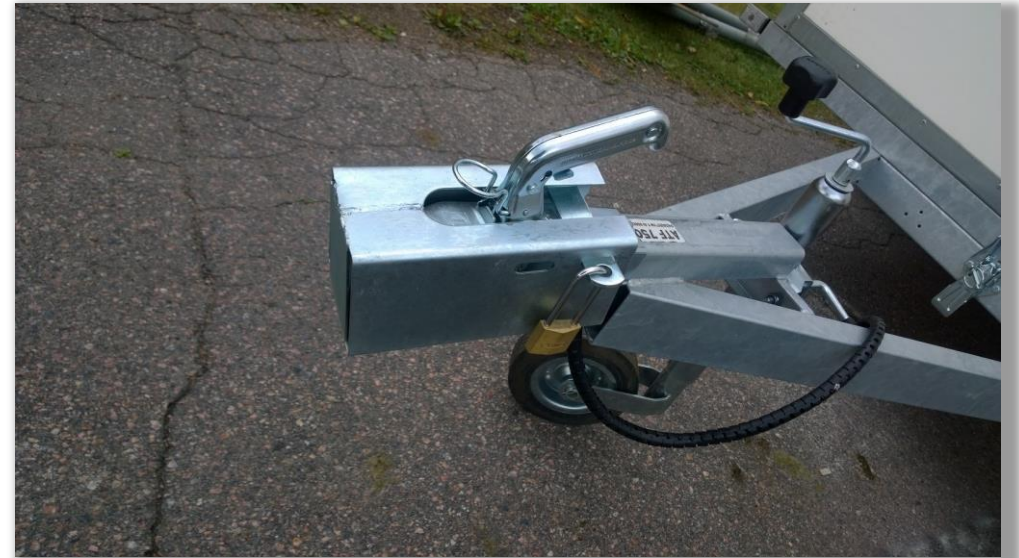
Bild 2. Koppling av släpet till bilens dragkrok