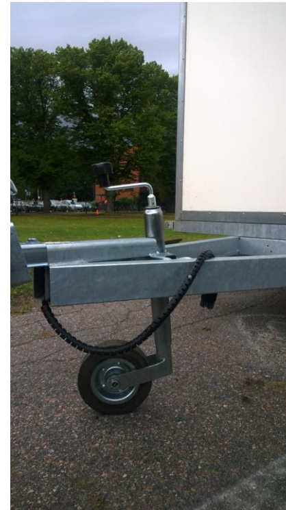
Bild 4. Släpets bakre stödben nedfällda